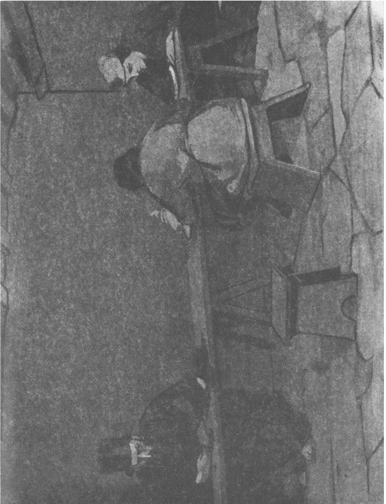
Στο πλάγι τους ένας καλόγερος με πολύ μαύρα γένια και μικρά μαύρα μάτια...